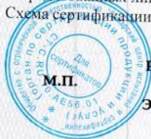
Схема сертификации 4.

НА ОСНОВАНИИ акт оценки оказания услуг (работ) № 00352 от 26.02.2021, протоколы испытаний продукции общественного питания №№ 1303 МБ, 1304 МБ, 1305 МБ от 25.02.2021 Испытательной лаборатории Общества с ограниченной ответственностью "Самарский центр испытаний и сертификации", уникальный номер записи об аккредитации в реестре аккредитованных лиц RA.RU.21AB46 от 09.02.2016.